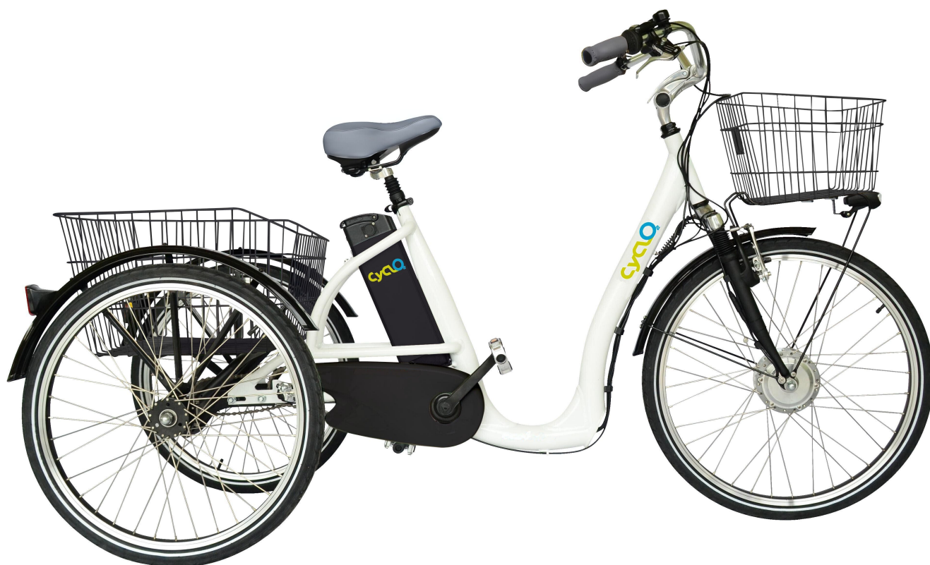
tricycle électrique CyclO2 Comfort26 blanc, vue de profil